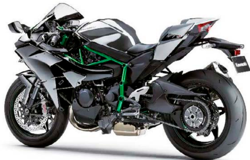
Sopra, la H2 stradale. A sinistra, la Vulcan S con motore bicilindrico parallelo 650

Kawasaki mette targa e fari alla sua supersportiva sovralimentata. Arriva anche una roadster di media cilindrata, la Vulcan S