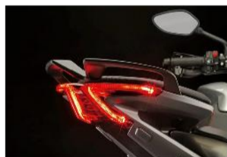
Dettagli di stile: il gruppo ottico posteriore e il terminale a tre vie

versioni sono disponibili con il sistema di frenata ABS e con una strumentazione che sfrutta un display TFT da ben 5". La Turismo Veloce Lusso propone anche un evoluto sistema di acquisizione dati GPS. Di serie anche le valigie dal ridotto ingombro trasversale, ma dall'ampia capacità di carico (60 litri), l'immobilizer e le manopole riscaldabili.