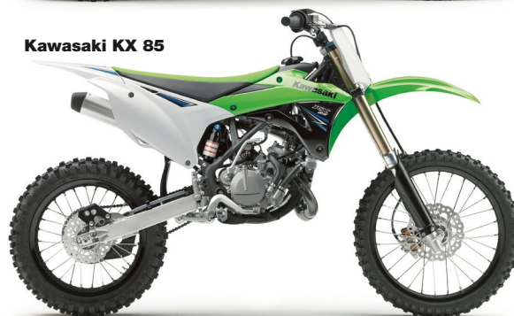
Kawasaki KX 85