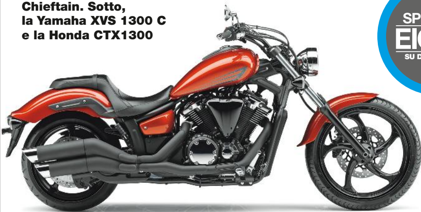
Qui sopra, la Indian Chieftain. Sotto, la Yamaha XVS 1300 C e la Honda CTX1300