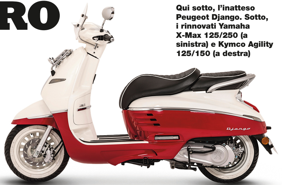
Qui sotto, l'inatteso Peugeot Django. Sotto, i rinnovati Yamaha X-Max 125/250 (a sinistra) e Kymco Agility 125/150 (a destra)

aggressivo e curato e compare un deflettore per deviare l'aria dalle gambe. Abbiamo poi una sella ridisegnata, pedane passeggero estraibili e una nuova piastra portaoggetti. Crescono poi l'escursione degli ammortizzatori e il peso, ora di 126 kg a secco per entrambe le versioni.