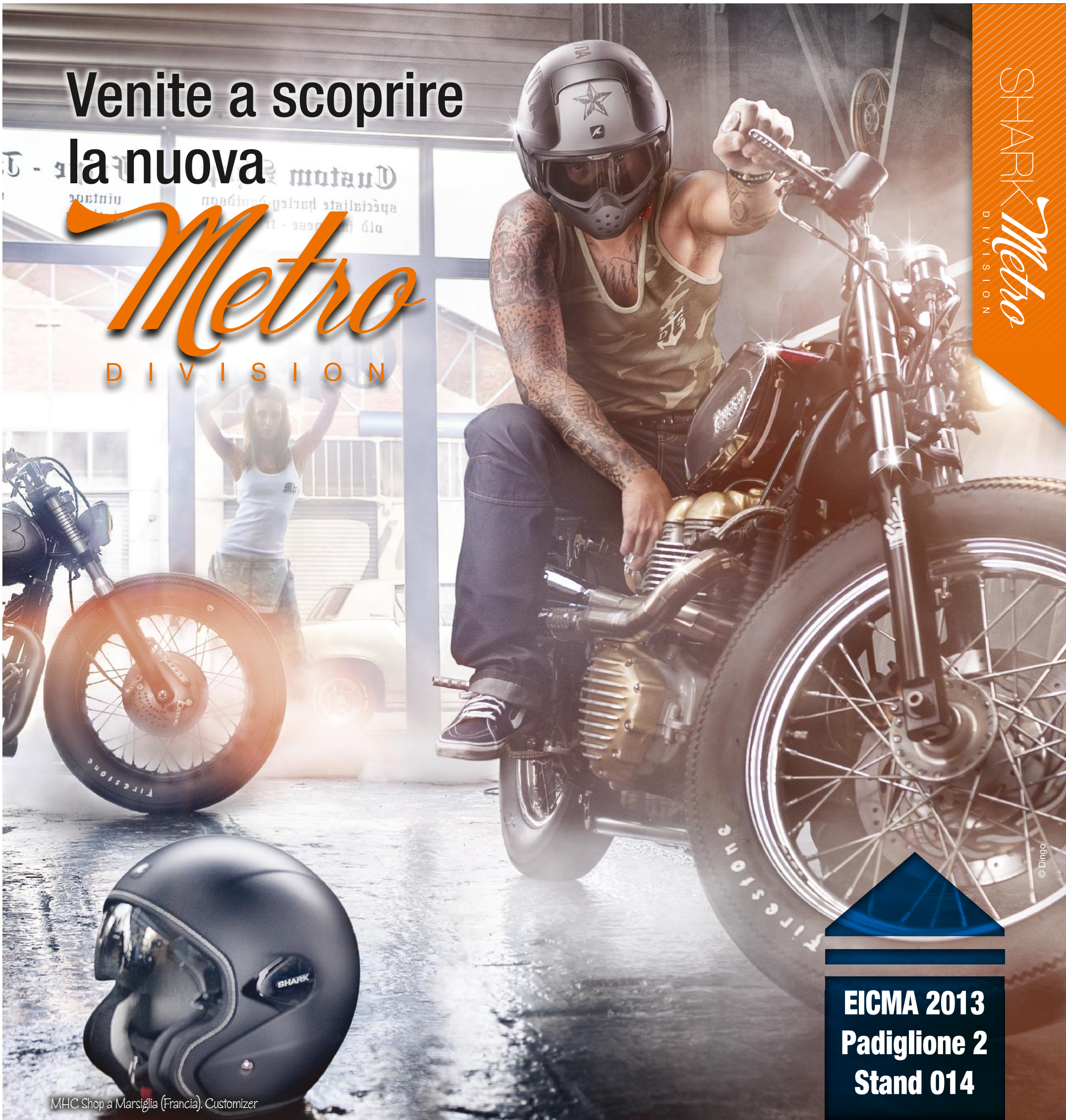
MHC Shop a Marsiglia (Francia). Customizer