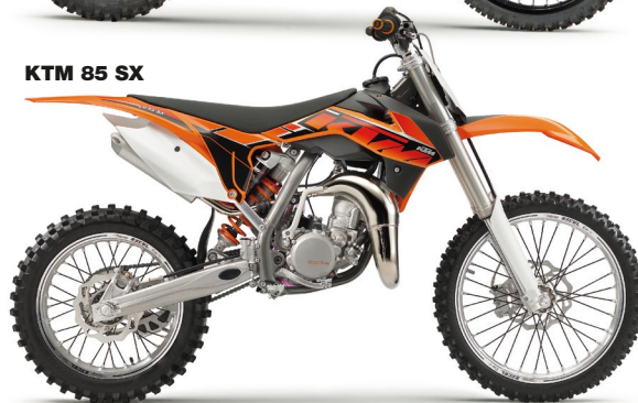
KTM 85 SX