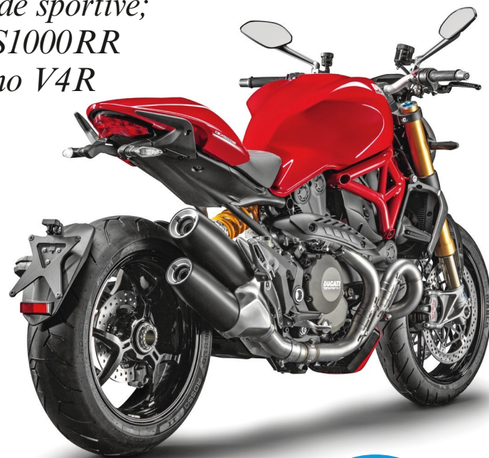
Tre "lati B" da infarto: Ducati (sopra), Aprilia e BMW (sotto)

no monoblocco Brembo e gestione elettronica aPRC (Aprilia Performance Ride Control) è rivista. Il serbatoio della Tuono è stato riprofilato e la capacità passa da 17 a 18,5 litri. La posizione di guida non cambia, ma la sella ora è ora più imbottita per migliorare il comfort. Arriva la nuova forcella Sachs a steli rovesciati da 43 mm con regolazioni dell'idraulica in compressione ed estensione separate "one by one" e una differenziale taratura del monoammortizzatore. Il V4, rivisto nella ventilazione dei carter e negli attriti interni, trova 3 CV in più e raggiunge i 170 CV a 11.500 giri per 111,5 Nm di coppia a 9.500 giri.