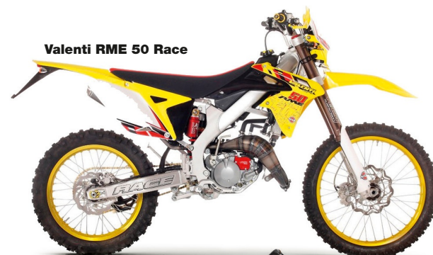
Valenti RME 50 Race