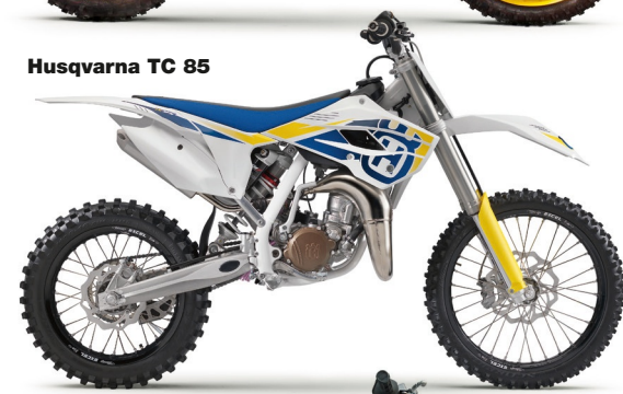
Husqvarna TC 85