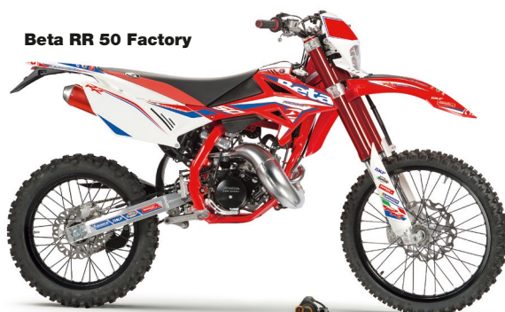
Beta RR 50 Factory